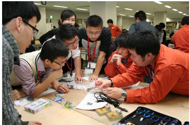
設計図を見ながら話し合う日中の大学生。1 月 30 日、東京電機大学で

東京電機大学との交流では、まずは日中混成のグループに分かれ秋葉原の電気街で部品を購入。その後、同大学のワークショップルームへ移動し、ロボットの共同製作に取りかかった。作業に先立ち、同大学未来科学部ロボット・メカトロニクス学科長の汐月哲夫教授（工学博士）が「交流を通じて、メカトロニクスと“モノづくり”を体感し、